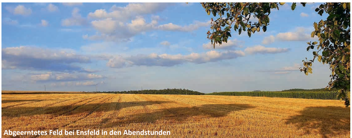
Abgeerntetes Feld bei Ensfeld in den Abendstunden