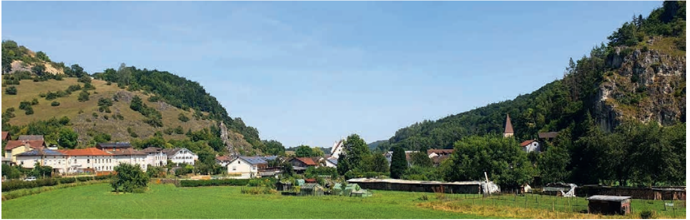
Blick in das Gailachtal